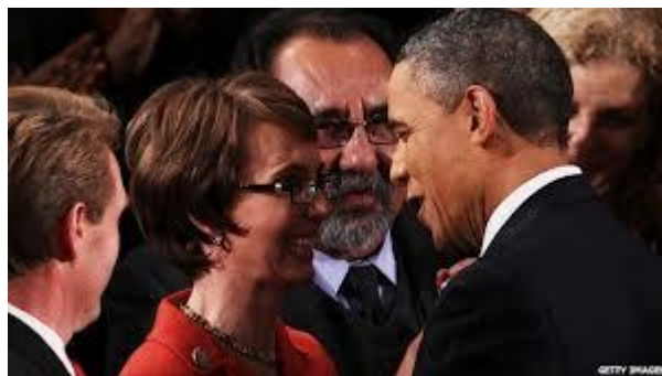
Barack Obama és Gabrielle Giffords

Az egész ország megrendült a véres erőszak hírére, és sokan a Tea Partyt, Sarah Palint és a céltábláit okolták a merényletért. Giffords azok közé a képviselők közé tartozott, akikben erős volt a szociális elkötelezettség. Obama nagyra értékelte a munkáját, hiszen Giffords számára a politika valóban a szolgálat, a jobbítás eszköze volt, nem cinikus hatalmi játék, vagy anyagi érdekek érvényesítésének terepe.