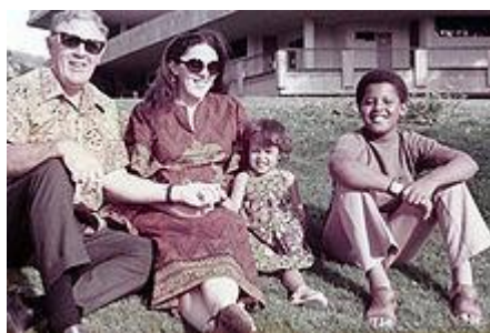
Obama Honoluluban édesanyjával, nagypjával és féltestvérével

Obama életútja sok tekintetben eltér az alsó középosztályból felemelkedő afrikai-amerikaiakétól, hiszen ő Havaiin született, édesanyja brit bevándorlók leszármazottja, apja pedig kenyai diák volt, aki két év házasság után elvált, és visszatért Afrikába. Obama Havaiin és Indonéziában töltötte gyermekkorát, és csak a középiskola befejezése után folytatta tanulmányait az amerikai kontinensen.