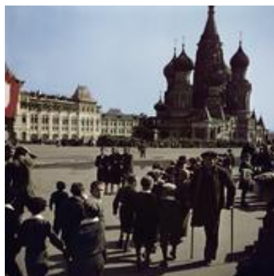
A Vörös tér a Vaszilij Blazsennij templommal