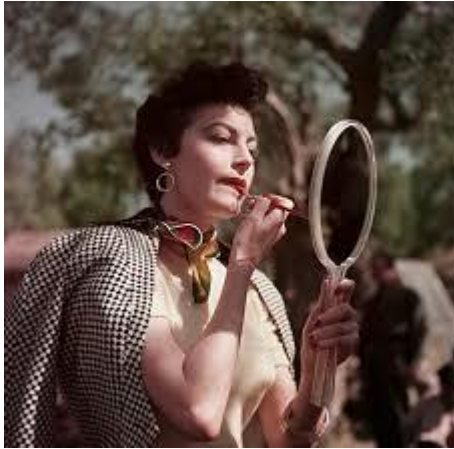
Ava Gardner a Meztlábás grófnő forgatásán