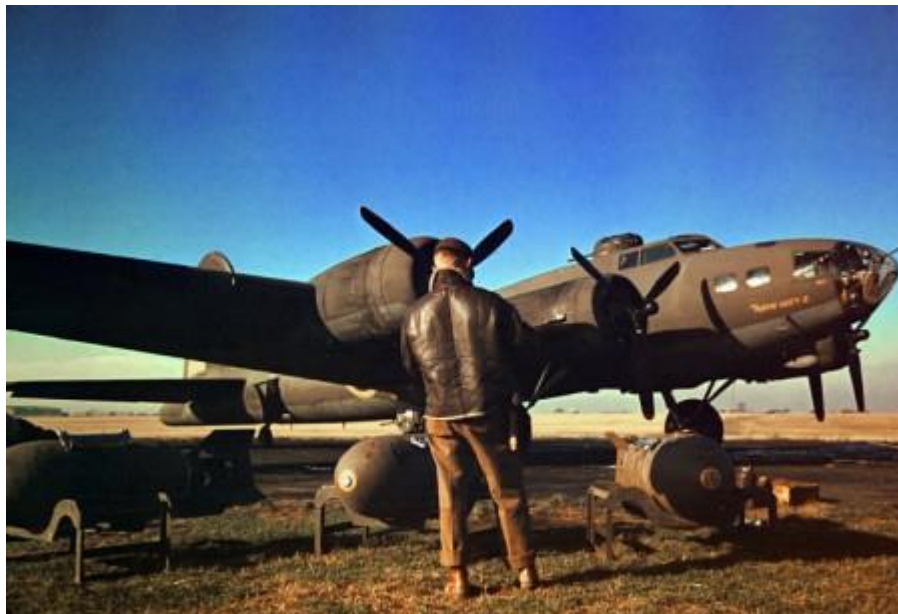
Franciaországi bevetés előtt Angliában 1941.

A legkorábbi háborús képei azonban Kínában készültek a második japán-kínai háború idején Hankow-ban (Hankou) 1938-ban.