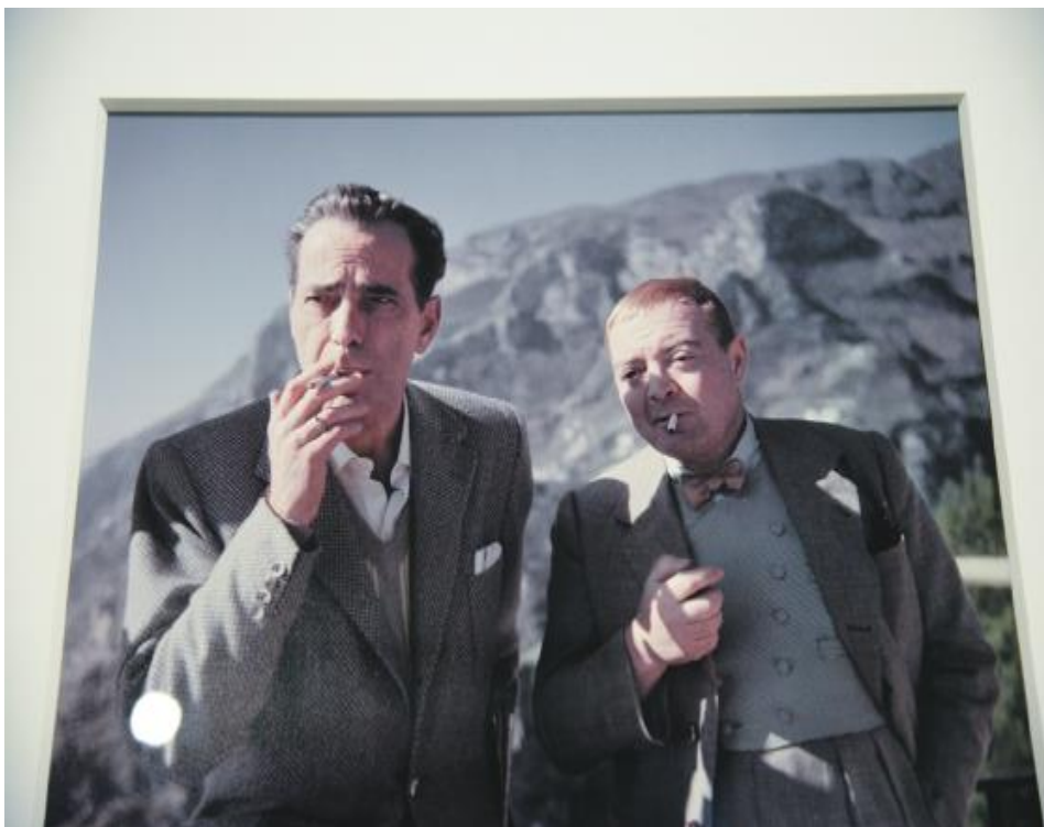
Humphrey Bogart és Peter Lorre, Olaszország, 1953