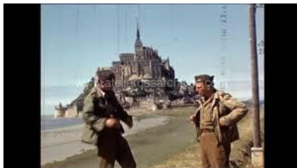
Hemingway és Capa. Mont-Saint-Michel 1944. Normandia

A háború után, a 40-es évek második feléből jól ismertek Capa oroszországi és izraeli képei, amelyek John Steinbeck-kel, illetve Irwin Shaw-val közös könyvükben jelentek meg. Különös most színesben viszontlátni őket. Íme az izraeli képek: