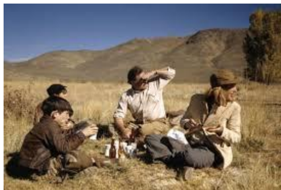
Hemingway a fiaival és Martha Gelhornnal. Idaho 1941

Ellátogatott Idahoba Hemingway-hez, és lefotózta az író két fiával és Martha Gelhornnal, aki akkor a felesége volt. Capa mindkettőjüket jól ismerte Spanyolországból.