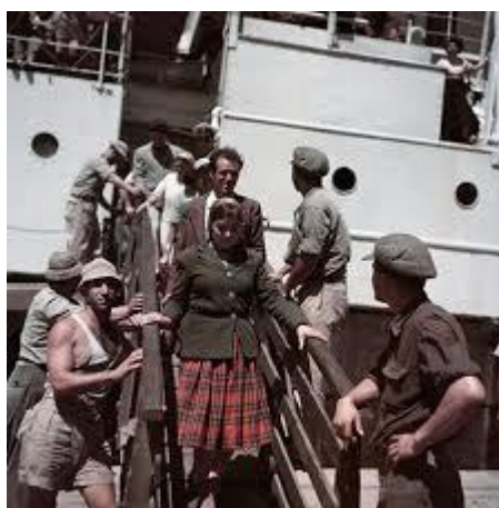
Új bevándorlók. Izrael, Haifa közelében, 1949.