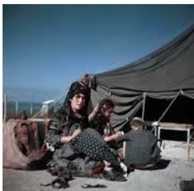
Izrael, Haifa 1949-50

A háború után, a 40-es évek második feléből jól ismertek Capa oroszországi és izraeli képei, amelyek John Steinbeck-kel, illetve Irwin Shaw-val közös könyvükben jelentek meg. Különös most színesben viszontlátni őket. Íme az izraeli képek: