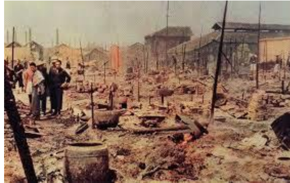
Hankou elleni japán légitámadás után 1938. július 19.

A kínaiak meghívására Gerda Taróval utaztak volna, hogy dokumentálják a japán légitámadásokat Vuhan tartományban. Indulásuk előtt azonban Taro halálos sérülést szenvedett fotózás közben a brunei fronton Madrid mellett. Temetése után Capa egyedül utazott Kínába.