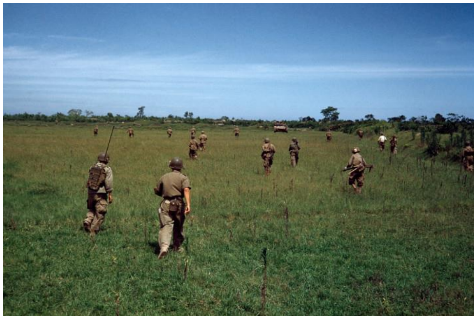
Indokína 1954. május

Ez a kiállítás utolsó képe. Különös zöldben látni ezt a rétet.