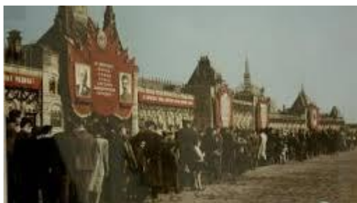
Hosszú sorok a Lenin Mauzóleum előtt

Az 50-es évek elejétől az Amerikában kibontakozó jólét már kedvez a színes magazinoknak. A szabadidő, az utazás, az elegáns síparadicsomok, a tengerparti üdülőhelyek, hírességek portréi, a divat keresett témák lettek. Capa színes fotói a svájci, osztrák és a francia Alpokban, a Riviérán, Biarritz-ban, Deauville-ban készültek, divatfotói Párizsban a Szajna-parton és a Vendôme téren.