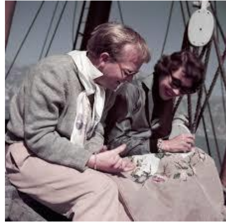
Truman Capote és Jennifer Jones a Beat the Devil forgatásán Olaszországban 1953. április