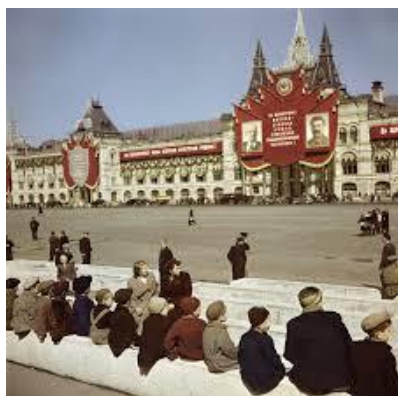
A Vörös téren