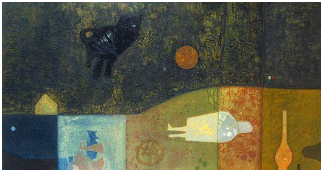
Honvagy (Párizs, 1959)

Honvagy (1959) című képe mégis azt mutatja, hogy szenvedett a gyökereitől távol. Szinte koporsóba temetve érezte magát barátai segítsége és a sok begyűjtött tudás, élmény, tapasztalat ellenére is.