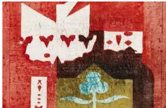
Ifjú szívekben élek 1969

A kollázs megújításához hozzájárult az a technika, amelyet egy takarítónőtől ellesett díszítő praktikával egészít ki. Ezt nevezte „ stelázi folklór ”-nak. Ugyanakkor saját műveit is lefotóztatta, hogy azokat is felhasználhassa új munkáihoz. Mindig szívesen hallgatott Bartók -zenét. Több kollázsán is megjelennek Bartók -kotta-részletek, de Vajda Lajos és Ország Lili emlékére is készített kollázsokat műveik, motívumaik felidézésével.