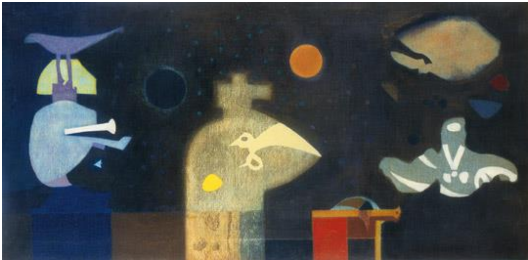
Allegro barbaro 1957-62