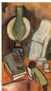
Petróleumlámpás csendélet 1937

Ezek felidézik pályakezdésének fauve-os, Czóbel-es, Chagall-os, expresszionisztikus orientációját, de egyúttal a Vajda Lajos-i szimultanista transzparenciájának, illetve Ámos Imre enteriőrjeinek hatását is ( Csendélet zsidótojással 1936, Petróleumlámpás csendélet 1937, Szentendrei dombok 1935-37, Poharas csendélet 1945, Piros sapkás önarckép 1945 stb. )