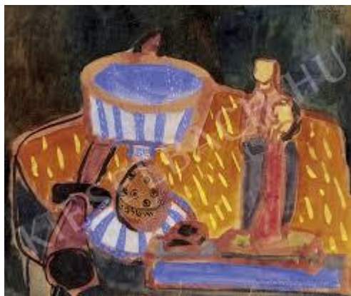
Csendélet zsidótojással 1936

Ezek felidézik pályakezdésének fauve-os, Czóbel-es, Chagall-os, expresszionisztikus orientációját, de egyúttal a Vajda Lajos-i szimultanista transzparenciájának, illetve Ámos Imre enteriőrjeinek hatását is ( Csendélet zsidótojással 1936, Petróleumlámpás csendélet 1937, Szentendrei dombok 1935-37, Poharas csendélet 1945, Piros sapkás önarckép 1945 stb. )