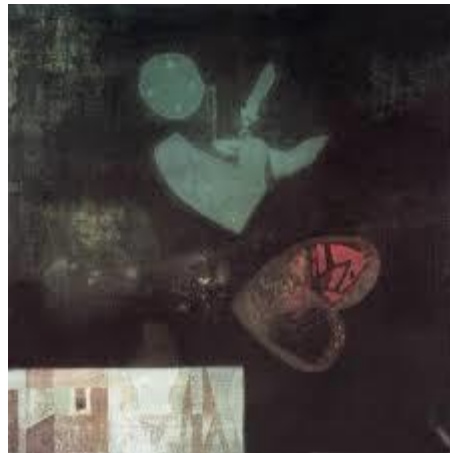
Népligeti álom 1960

A kiállítás következő nagyobb egységének középpontjában ennek a beérkezésnek a főbb alkotásai állnak, a bálinti szürrealista látásmód elmélyüléséről tanúskodó művek és a sajátos "Bálint-szótár" főbb motívumai. 1959-től egymás után születnek olyan jelentős festményei, mint a Vándorlegény útrakél (1959), a Csodálatos halászat (1960), a Népligeti álom (1960), Itt már jártam valaha I-II. (1960), amelyek e motívumok köré rendeződnek.