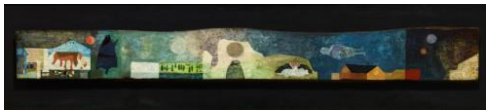
Itt már jártam valaha I. 1960.

Már Párizsban gyűjteni kezdte a kidobott ajtókat, bútorok, parketták darabjait, léceket, amelyekre festeni kezdett, illetve rákasírozott, rávasalt papírképeket, különös gyűrődéseket érve el a képfelületen.