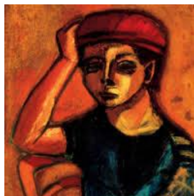
Piros sapkás önarckép 1946

A kontextus bemutatása azt jelenti, hogy a korai képek mellett felvillannak Czóbel Béla, Vajda Lajos, Picasso, Braque és Max Ernst művei is, a későbbi művek háttéréként, főként a Jeruzsálemi Biblia képeinek ihletőjeként látható egy sorozat Chagall Biblia-illusztrációiból.