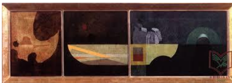
Csodálatos halászat 1960.