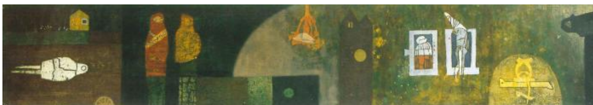
Séta a temetőben 1960

Időrendi és egyben tematikus egység az objektek bemutatása. Bálint a 60-as években fedezte fel a tárgyak, az objektek világát. Használt, törött, kopott, kidobott tárgyakat újjáértelmezve hozott létre műalkotásokat. A kiállítás ezeket oltárszerűen rendezi el, amely hasonlóan a párizsi műterem-rekonstrukcióhoz, látványos, de hamis. Túl szép, túl természetellenes, túl szakrális, túl színpadias. A bemutatás módja elfedi a „talált tárgy” rusztikusságát, amelyet Bálint átértelmezve is megőriz.