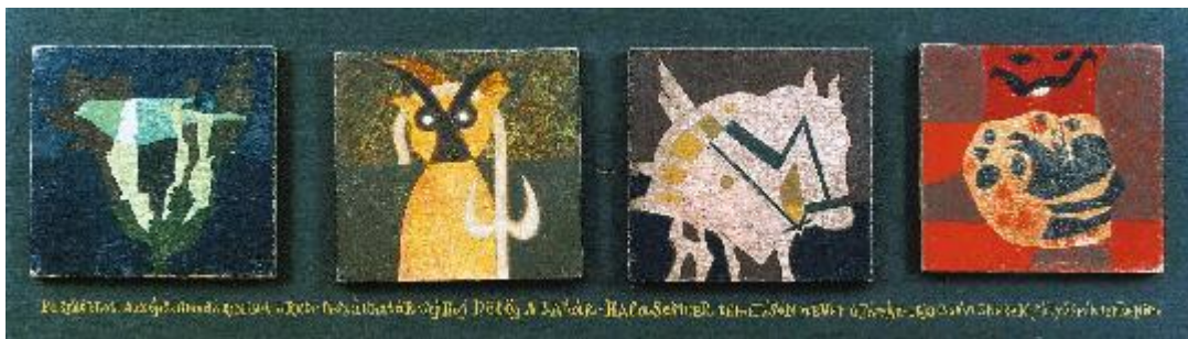
Felszállott a szépségmadár 1961