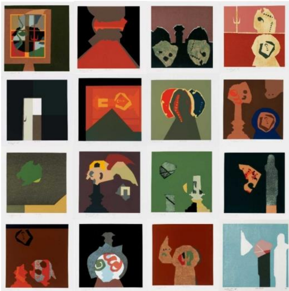
Bálint Endre: Szonettek