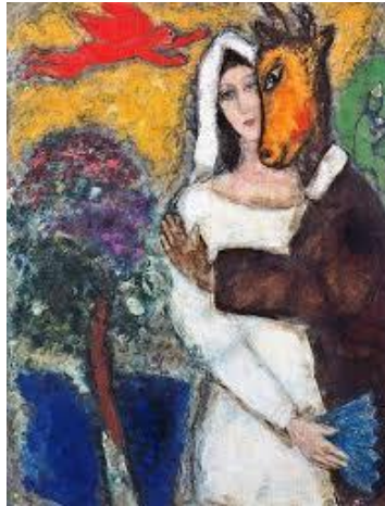
Szentivánéji álom 1939

(Ez volt az első alkalom, hogy az Élet külföldön látható volt. Falat kellett bontani, hogy beférjen a Galériába.)