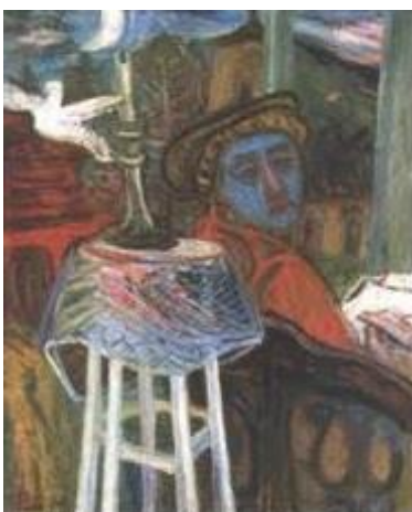
A festő, 1939