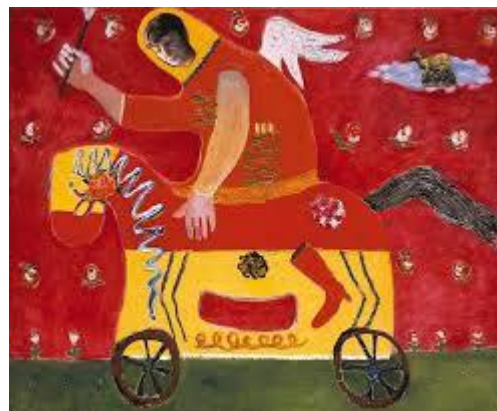
Ars poetica 1970