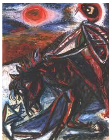
A tetű az Apokalipszis lovasa 1944