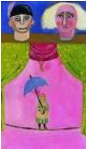
Máriácska II. 1968.