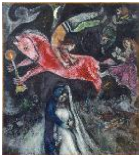
A vörös ló (1938-44)

Chagallt jól ismerem kamaszkorom óta. Már sokszor elmondtam, hogy amikor be voltunk zárva a vasfüggöny mögé, a Váci utcai idegen nyelvű könyvesboltba jártunk Skira kiadású képzőművészeti kiadványokat nézegetni. Fantasztikusak voltak a reprodukcióik. Egy-egy életmű jól áttekinthető volt egy ilyen vaskos kötetből. Aztán voltak olcsóbb, vékonyabb, papírkötésű olasz kiadványok is, amelyeket időnként meg is tudtunk venni.