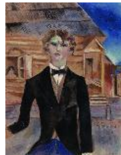
Önarckép a ház előtt (1914)

Chagall-kiállítást először a 70-es évek elején láttam Pesten. Később, amikor már utazhattunk, a világon mindenfelé láttam a képeit, Moszkvától Párizsig, New Yorktól Chicagóig és Izraelig. Az ágyam fölött most is van négy kis bekeretezett reprodukció tőle.