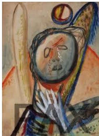
Síró angyal, 1944