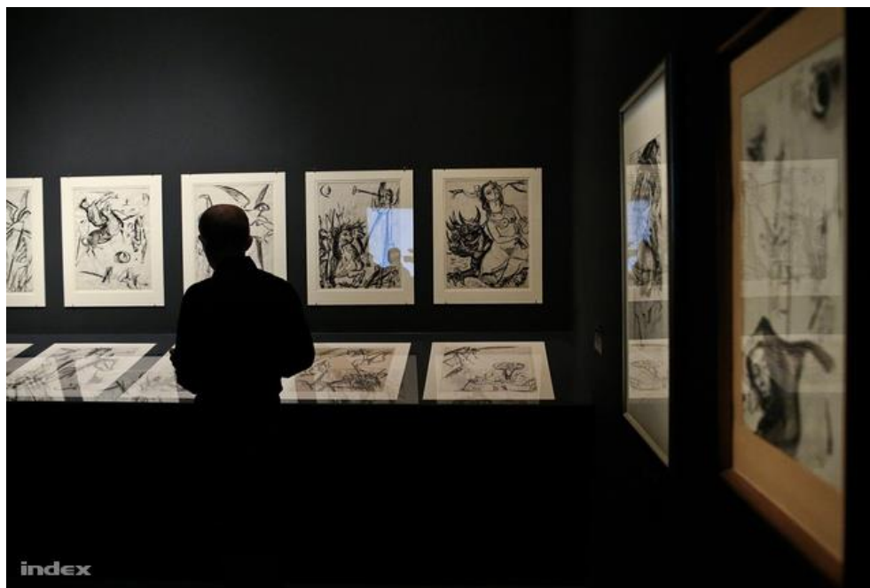
Az Apokalipszis lapjai