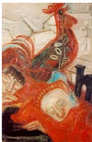
Hajnalvárás, 1938 körül

A korai korszak képei ( Hajnalvárás , Égő zsinagóga , Sárga angyal , Szentendre II. ) és az utolsó évek alkotásai azonban sokkal expresszívebbek. Az utolsó években drámaivá válik a festészete mind témájában, mind a színek használatában, mind az ecsetkezelésben ( Setét idők , Iszonyat , Síró angyal , Az Apokalipszis lovasa ).