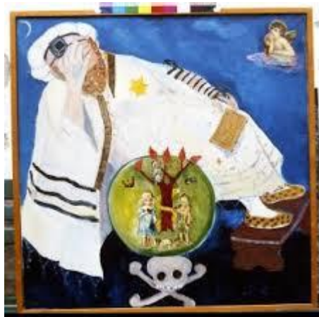
Az alkotó pihen

A határozott körvonalú, erős színekkel megalkotott képek, a hagyomány játékos-komoly átértelmezése, más idősíkba, térbe, kontextusba helyezése rokonítja őt leginkább e korszakában az orosz-francia mester látásmódjával.