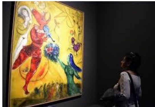
A tánc (1950-52)